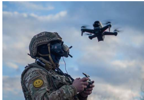
Інвестиції у виробництво FPV дронів DTE-1