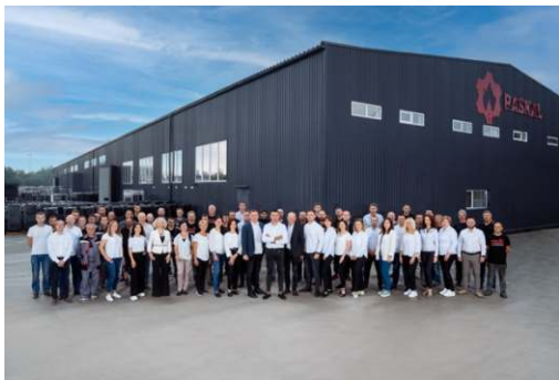
Інвестиції в підприємство з металообробки та виробництва теплотехнічного обладнання