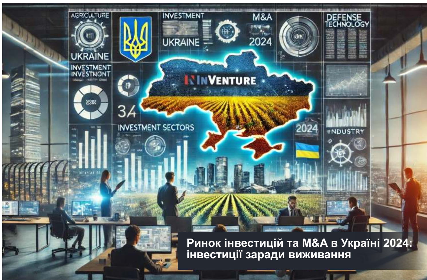
Ринок інвестицій та М&А в Україні 2024: інвестиції заради виживання