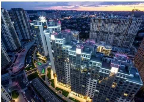
Найкращі житлові комплекси Києва у 2025 році